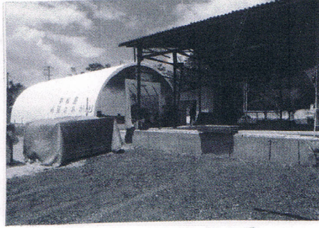
「奥松島希望のあかり商店街」全体図